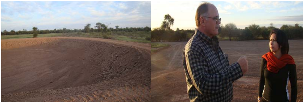
Fotografías del Relleno Sanitario del Municipio, en construcción.

Se tiene ya la iniciativa de impulsar el proyecto de manejo de los desechos sólidos del Municipio. Se dispone ya del área para el vertedero y los primeros trabajos en ejecución.