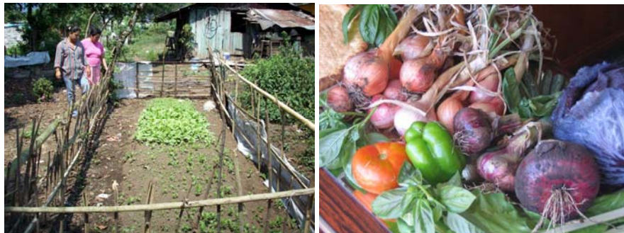
Ejemplos de producción en pequeñas áreas familiares.

El proyecto debe buscar el autoabastecimiento de hortalizas y follajes de consumo familiar y algunos excedentes para la venta local. Los huertos familiares, no requieren áreas grandes ni altos consumos de agua. El huerto va desde un macetón, hasta un pequeño cercado que puede ser menor de 10m 2 en el cual se diversifican plantas de consumo familiar. En algunos casos se pueden cultivar algunas plantas de ciclo corto, como melón, sandía, mamón y de ciclo largo, como cítricos en pequeño número que permita el riego.