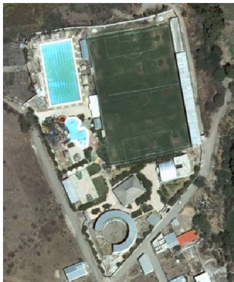
Polideportivo en Santa Catarina Mita, Jutiapa, Guatemala.

La recreación es otro rubro que debe formar parte de los programas municipales, institucionales, organizacionales y comunales en áreas de esparcimiento y en locales en donde se promuevan actos culturales y sociales para el bienestar físico y mental de la población.